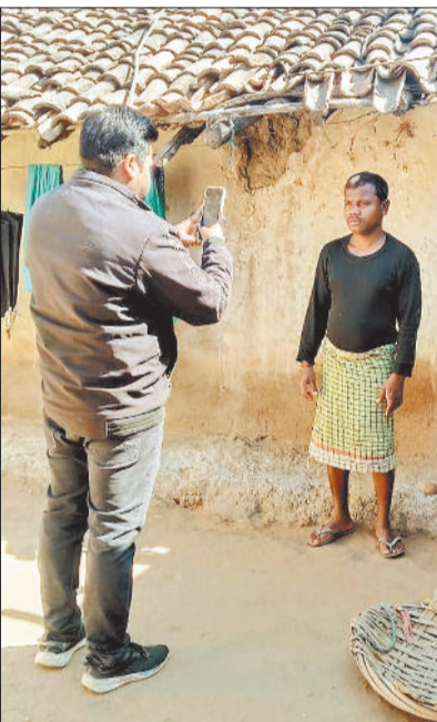
हरिभूमि न्यूज ►► बैकुंठपुर

ग्रामीण विकास को नई गति देने के उद्देश्य से लागू की गई वीबीजी रामजी योजना के तहत कोरिया जिले ने तकनीकी पारदर्शिता की दिशा में बड़ी उपलब्धि हासिल की है।