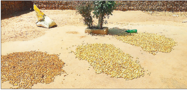
संग्रहित कर रखे गए महुआ फूल।

इन दिनों ग्रामीण परिवार खेती कार्य से फुरसत में हैं और ऐसे समय में महुआ फूल चुनने में जुटे हैं, इससे ग्रामीण परिवारों को अच्छी खासी आमदनी भी प्राप्त करते हैं। जंगलों के अलावा ग्रामीण क्षेत्रों में स्थित महुआ के पेड़ों के नीचे सुबह होने के पूर्व से ही ग्रामीण अपने परिवार के सदस्यों के साथ पहुंचते हैं और घंटों महुआ फूल चुनने के कार्य में व्यस्त रहते हैं। कई ग्रामीण परिवार जिनके