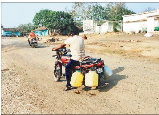
बाइक से लम्बी दूरी तय कर पानी लेजाता ग्रामीण।

गर्मी बढ़ने के साथ ही विकासखण्ड मुख्यालय ओड़गी के लोग भीषण जल संकट से जूझ रहे हैं। पानी की समस्या पिछले डेढ़ महीने से चल रही है लेकिन पिछले एक पखवाड़े से यह समस्या विकराल बन गई है तथा लोगों को पानी के लिए तरसना पड़ रहा है। पहाड़ी इलाका